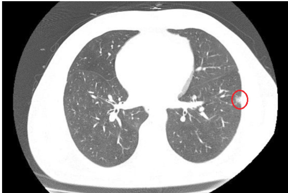
Figura 1. Tomografia de tórax evidenciando pequena opacidade nodular, circundada por halo em vidro fosco no pulmão esquerdo.

reativa (>16 mg/dL). A bioquímica e função hepática, assim como função renal, troponina e procalcitonina encontravam-se dentro dos limites da normalidade. A tomografia contrastada abdominal confirmou a hipótese de apendicite aguda, sendo complementada com tomografia de tórax que evidenciou pequena opacidade circundada por halo em vidro fosco no pulmão esquerdo (Figura 1).